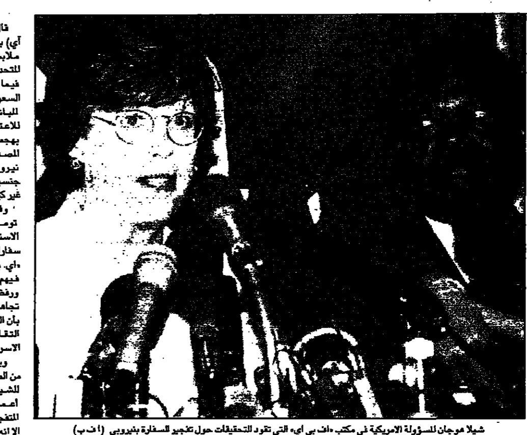
شيلا هوران المسؤولة الأمريكية في مكتب اف. بي. أي التي تقود التحقيقات حول تفجير السفارة بنيروبي